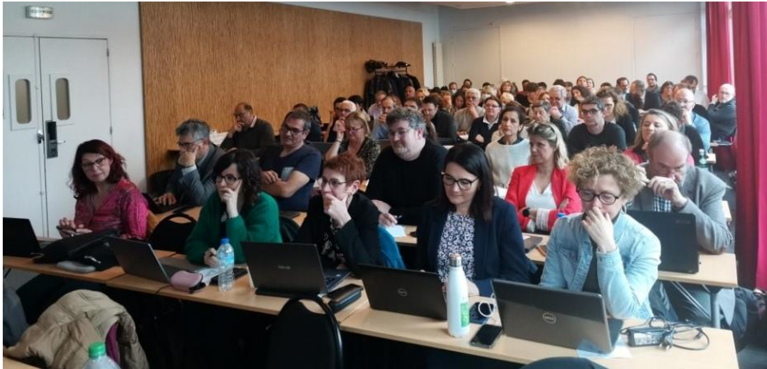
Le Lab des directeurs 17 octobre 2022

Les directeurs Cap emploi se sont réunis le 17 octobre en mode Lab pour faire un bilan des actions menées suite au Lab de 2020 et entamer une nouvelle série de réflexions sur 3 thèmes