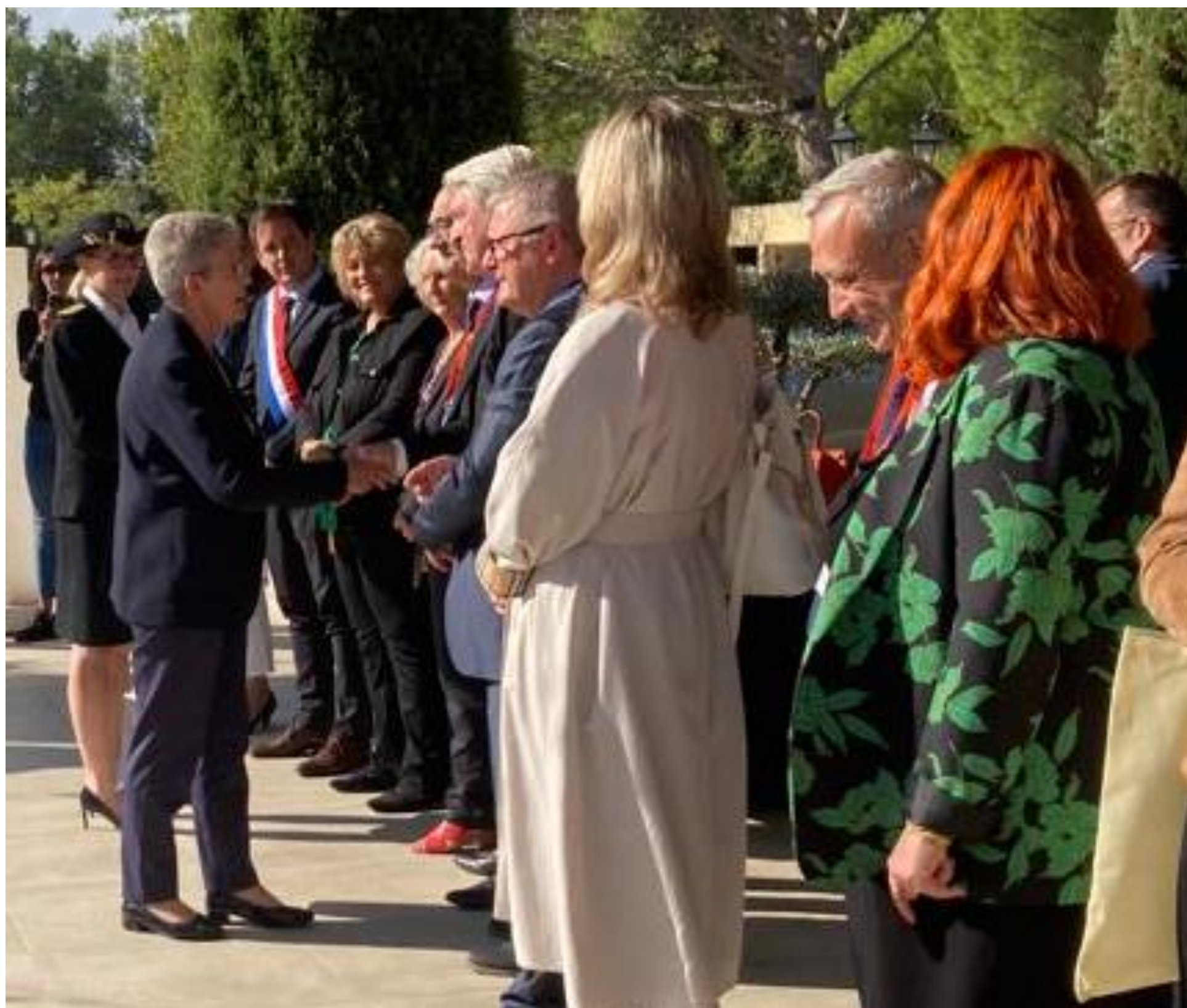
Congrès Cheops Septembre 2022

Le réseau des Cap emploi s'est réuni les 21-22 et 23 septembre dans le Grand Avignon en présence de Madame Geneviève Darrieussecq, Ministre chargée des personnes handicapées. Plus de 250 Administrateurs et Directeurs de Cap emploi étaient présents